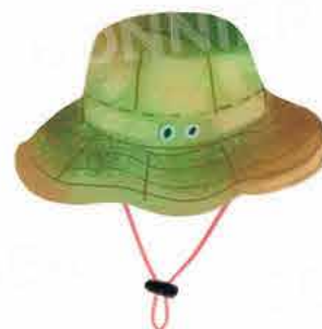
Шапка с широка периферия