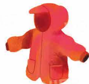
Непромокаемо яке или дъждобран