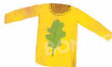
Лека върхна дреха с дълги ръкави