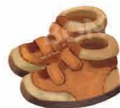
Стабилни и удобни обувки