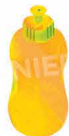
Бутилка с вода