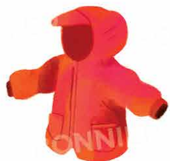
Непромокаемо яке или дъждобран