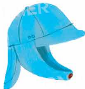
Непромокаема шапка или качулка