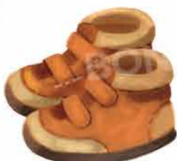
Стабилни и удобни обувки