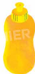
Бутилка с вода