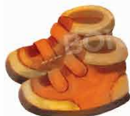
Стабилни и удобни обувки