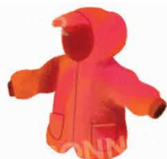
Непромокаемо яке или дъждобран