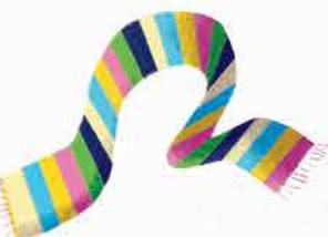
Топли дрехи, шапка и шал