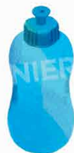
Бутилка с вода