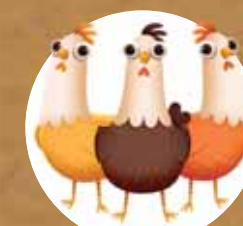
Фло, Джо и Шърли – кокошки веселячки