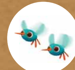
Колибрите Бъз и Зинг