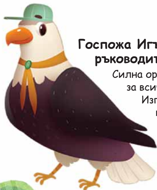
Госпожа Игъл, ръководителка на лагера

Много възрастна и мъдра орлица. Тя е предишната ръководителка на Горския лагер.