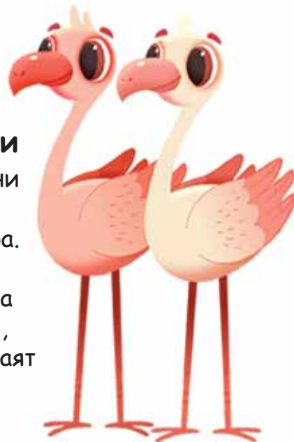
Роузи и Руби

Най-добрата приятелка на Одо. Симпатично птиче, което винаги е готово да се притече на помощ.