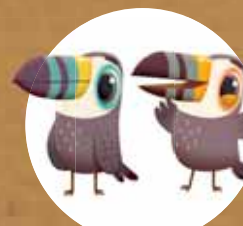
Туканите Бъд и Луи