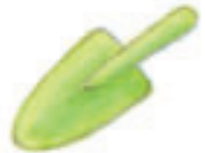
Лопатка за пясък

Пребройте по колко от тези неща има в илюстрацията.