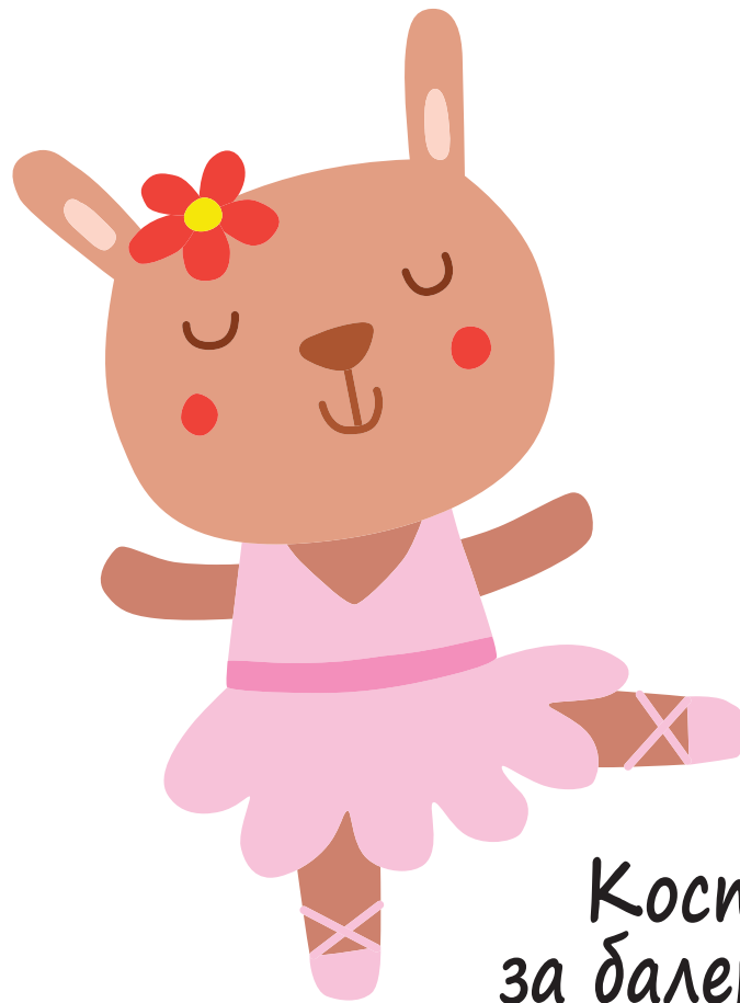
Костюм за балерина