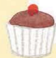
Снимка как се храниш