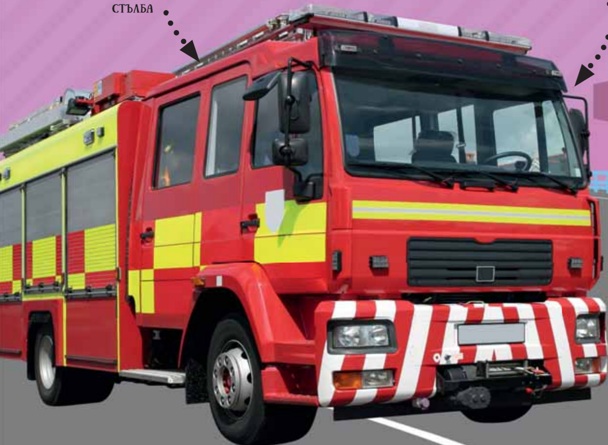
КАБИНА ЗА УПРАВЛЕНИЕ