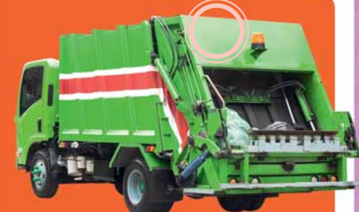
КАМИОН ЗА СЪБИРАНЕ НА СМЕТ (БОКЛУКОВОЗ)