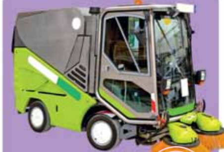
КАМИОНЧЕ ЗА ПОЧИСТВАНЕ НА УЛИЦИ

Тя е оборудвана с маркучи, резервоар за вода и пена за гасене на пожари. Разтегателна стълба издига пожарникарите, за да потушат огъня на високите етажи.