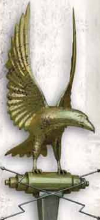
Знакът на легиона – орел с разперени крила, държащ в ноктите си мънция. Бил носен от аквилифер.

Снаряжението на римските пехотинци останало сравнително непроменено векове наред. Бронята, щитът и оръжията (копия, меч и кама) тежали общо около 20 кг. Под бронята носели червена туника. Коланът бил с украса, но войниците носели опростен вариант. На краката носели калиги – много здрави военни сандали с подметки от няколко пласта кожа, подсилени с железни гвоздени. Легионерите в студените северни провинции имали дебели вълнени наметки, а под туниката носели панталон, възприет от спомагателните войски.