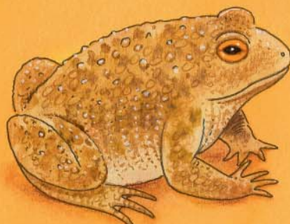
Кафява крастава жаба