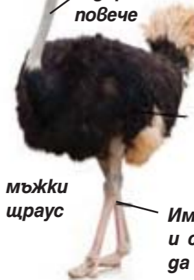
гола шия, дълга метър и дори повече